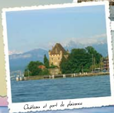
Château et port de plaisance