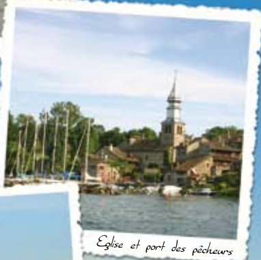
Eglise et port des pêcheurs